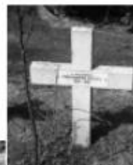
Могилы неизвестных русских солдат и военнослужащих