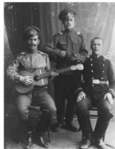
65-й московский пехотный полк