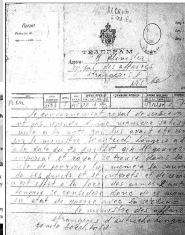
Телеграмма, отправленная правительству Сербии 28 июля 1914 г. об объявлении войны правительством Австро-Венгрии. Подписана министром иностранных дел графом Леопольдом Берхтольдом