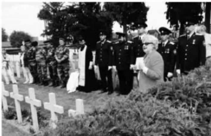
Поклон оренбургских казаков. 1-7 июня 2015 г.