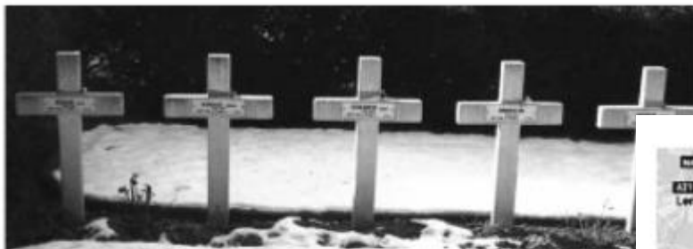
Трогательная деталь: чьей-то доброй рукой эти кресты были отмечены повязанной на них георгиевской лентой - символом русской воинской доблести. На кресте написано: ПОГИБ ЗА РОДИНУ