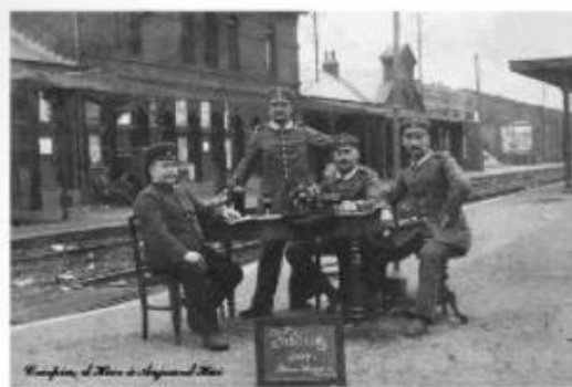
1-й баварский батальон, Ландштурм из Мюнхена во время кампании 1914 г. в Бланс-Миссерон