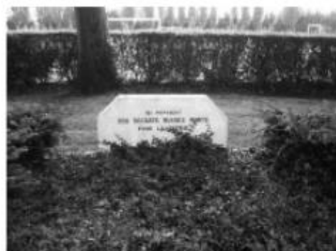
Здесь покоятся 200 русских солдат, погибших за Родину